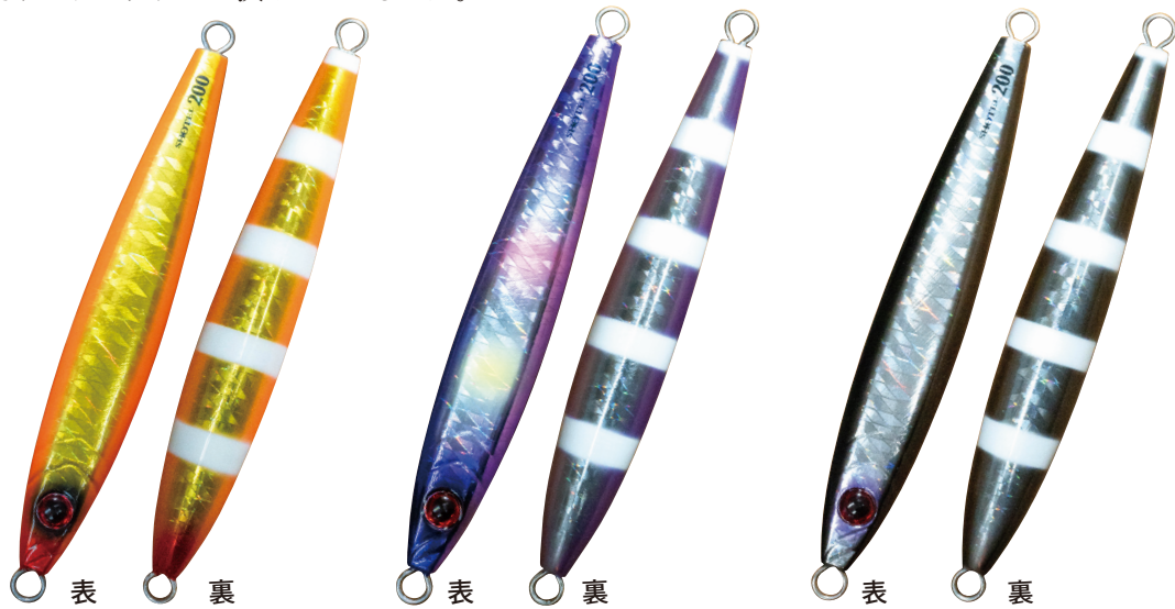
#196 ゼブラオレンジゴールド

「ショーテル」は太身の「ランス」と言えるジグ。前後にフックをセットした時のクレイドルフォールアクションがバイトを誘発する。「ランス」の弱点とはなんだろうか。浅場で警戒心を煽るロングシルエット…。深場でのクレイドルフォールの持続性…。「ショーテル」はクレイドルフォールを武器として、浅場では短いスモールシルエットでナーバスなターゲットをバイトさせる。深場では極太ボディがリーダーやメインラインの影響を抑えクレイドルフォールが持続しやすい。「ショーテル」に適したジャークスタイルは何だろうか。全てのジグに言えることだが、ジグにスローピッチとハイピッチの適性について明確な線引きは出来ない。ターゲットを仕留めるための条件を考え、タックル、フックのセッティングを工夫して、どのようにジグを操作するか。それはアングララーが決めることなのだ。